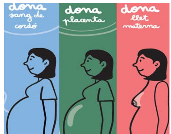
Imatge del Tríptic: S'està iniciant el seu desplegament poc a poc en centres que poden implementar aquest tipus de donació múltiple

Tots ells han treballat per assegurar que el circuit funcioni bé i els productes arribin al Banc de Sang i teixits a temps per poder-ne fer un ús terapèutic.